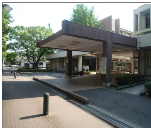
写真 1 写真の一例